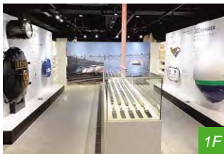
鉄道の技術と新潟・新津