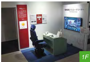
シミュレータコーナー