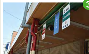
国鉄カラーの商店街アーケード にいつ0番線商店街のアーケードの支柱の塗装が、クリーム色と赤色の国鉄の特急列車の配色となっています。