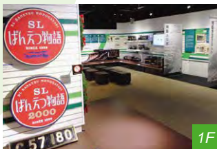
新潟・新津の人々と鉄道