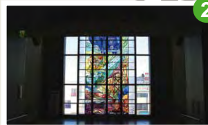
「花の道 夢の道」ステンドグラス 2003年の3代目新津駅開業に併せて彫金師・宮田亮平氏作品「花の道 夢の道」のステンドグラスが設置されています。新津駅ではシュブリンゲンや陶板など計4作品の宮田作品を観ることが出来ます。