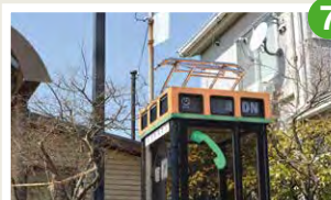
パンタグラフをのせた公衆電話 新津駅近くの公衆電話ボックスの屋根に電車のパンタグラフ型のオブジェが設置されています。