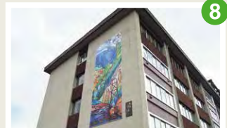
「花の道 夢の道」原画パネル SLをモチーフにした新津駅のステンドグラスの原画を横4m縦8メートルに引き延ばして新津鉄道資料館、新津地域学園のランドマークとして設置しています。