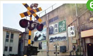
まちなか鉄道資料館 踏切警報機 三村歯科医院前に鉄道資料館資料の踏切警報機が設置されています。