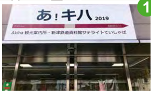
駅中サテライト「ていしゃば」 鉄道資料館への交通アクセス案内のほか、レンタサイクルの貸し出しを行っています（「あきハ」観光案内所内）。