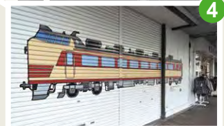
まちなか鉄道資料館 鉄道シャッターアート エリア内に11カ所の鉄道シャッターアートが描かれています。それぞれのアートには様々な隠れキャラがいまから探してみよう。