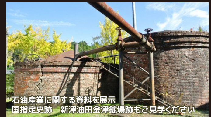
石油産業に関する資料を展示 国指定史跡 新津油田金津鉦場跡もご見学ください