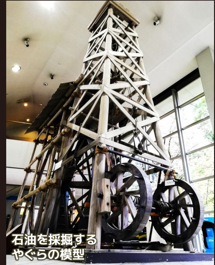
石油を採掘する やぐらの模型